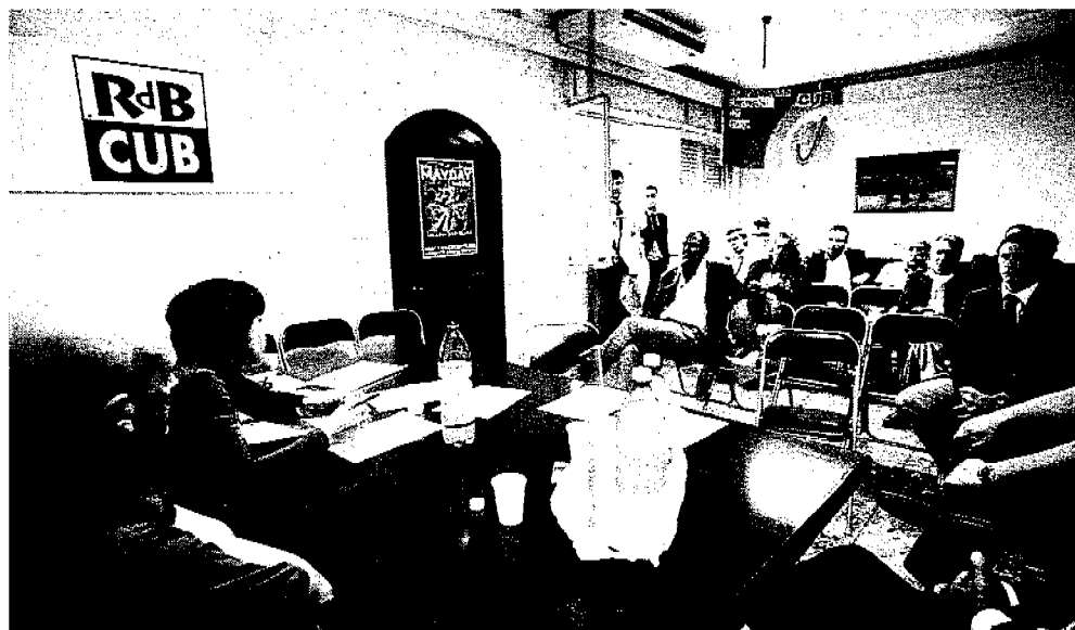
Dipendenti Intesa Sanpaolo in assemblea. A destra la sede dell'Ordine dei commercialisti

Pronti allo sciopero per le 25 agenzie che Intesa Sanpaolo dovrà dismettere